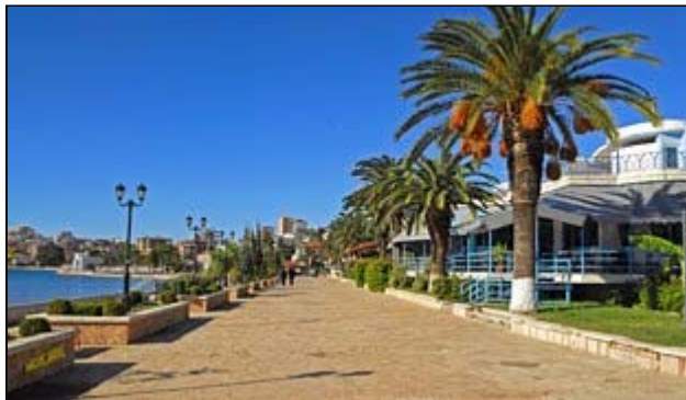
Flanieren Sie entlang der Uferpromenade Sarandes...