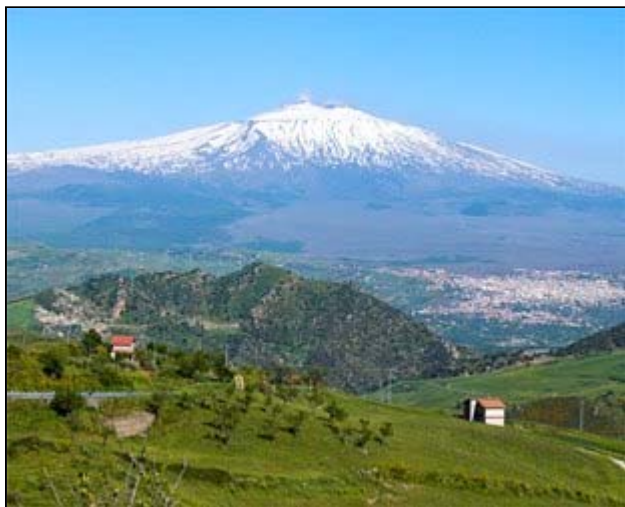
Der imposante Vulkan Ätna auf Sizilien...