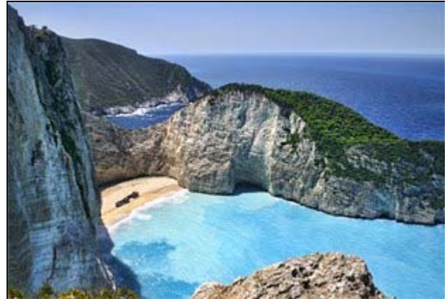
Besuchen Sie die Navagio-Bucht auf Zakynthos...